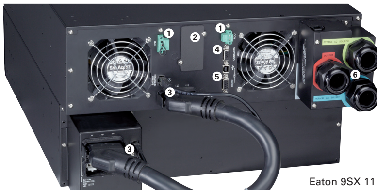
Eaton 9SX 11 кВА